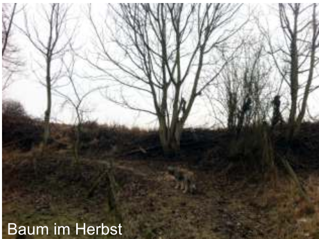
Baum im Herbst

Geradeaus kommt Ihr genau auf diesen Baum zu. Hier sucht Ihr einen PETling. Schreibt Euch die Zahl auf.