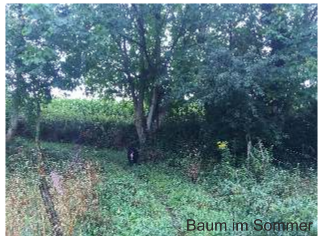
Baum im Sommer

Danach geht es den Pfad einfach weiter bergauf . Ihr überquert dann eine Wiese und kommt auf einen Hauptweg. Schräg rechts hinter Euch ist übrigens der Hemsberg gut zu sehen.